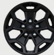
Rines de aluminio Willys de 17" en negro